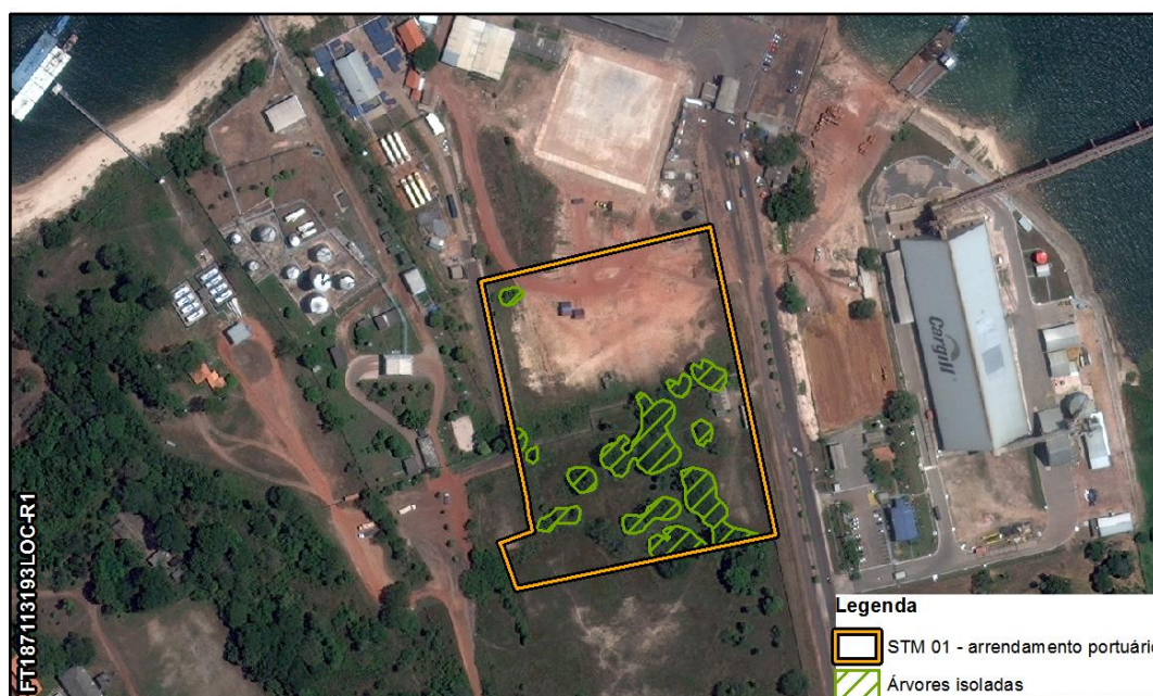
Figura 3.1.2.9-1 - Cobertura Vegetal STM-01

Considerando a supressão dos 30 indivíduos arbóreos, faz-se necessário a compensação dessa supressão, conforme será detalhado em programa específico. De maneira conservadora, está sendo adotado uma compensação de 50:1, ou seja, a necessidade de plantio de 1500 novos indivíduos, o que corresponde à aproximadamente uma área de 1 ha.