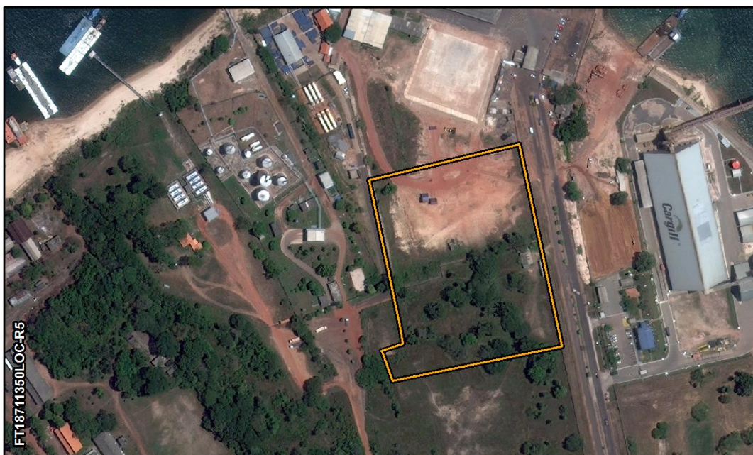
Figura 2-1: Delimitação aproximada da área STM-01.