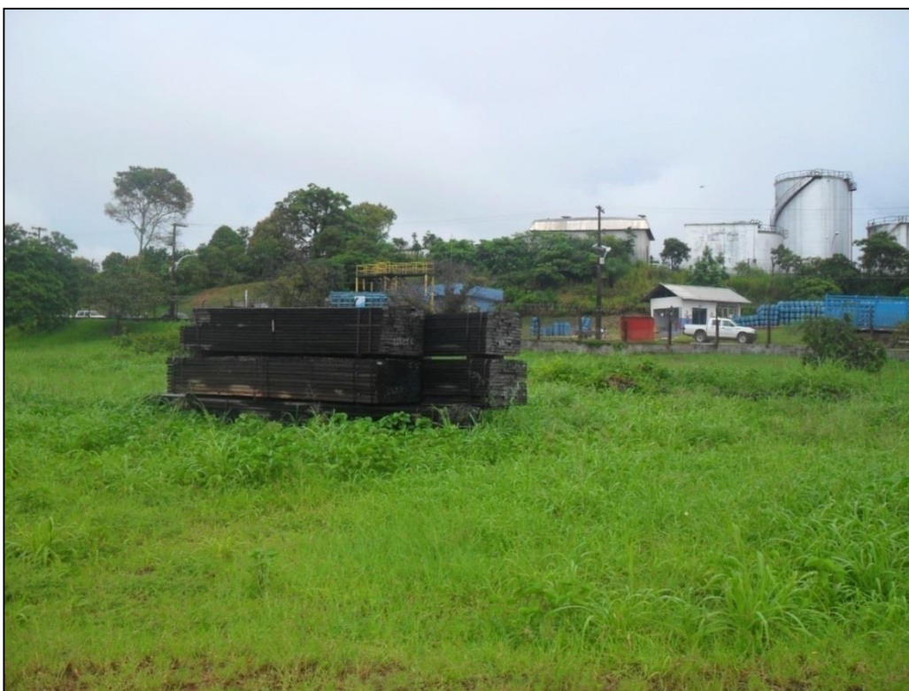
Figura 2-2 - Madeira deixada no local.